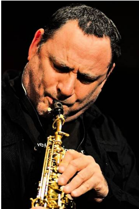
Töne, die unter die Haut gehen: Der Saxofonist Gilad Atzmon spielte in Brötzingen.

Sie sind hier: » Home » Nachrichten » Pforzheim